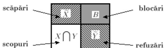
Figura 1: Tipuri de execuții

Înțelegerea stipulează că numai execuțiile din X \cap Y sunt permise să apară în prezența aparatului. Din această cauză, X \cap Y se mai numește și mulțimea contract , iar execuțiile x \in X \cap Y se mai numesc și scopuri , deoarece ele sunt legale atât pentru aparat, cât și pentru mediul. Mulțimea X conține execuțiile pentru care aparatul respectă înțelegerea (iar mediul poate să o respecte sau să nu o respecte); mulțimea Y conține execuțiile pentru care mediul respectă înțelegerea (iar aparatul poate să o respecte sau să nu o respecte). În mulțimea X \cup Y încă putem avea execuții cu gradul de acceptabilitate sau cu gradul de accesibilitate egal cu zero, dar nu ambele zero pentru o execuție dată (figura 1).